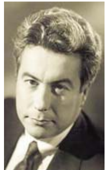
De eerste bestseller