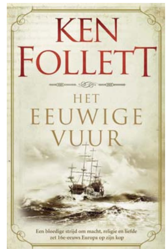
Kens nieuwste boek, Het eeuwige vuur, is het derde deel in de Kingsbridge-serie.