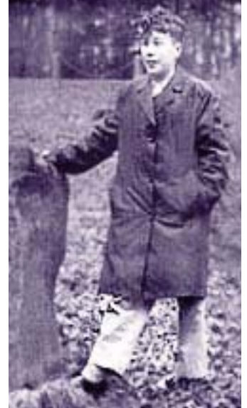
Een schooljongen in Wales