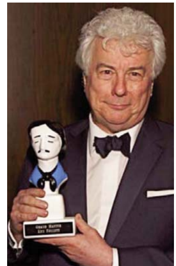
Verkozen tot Grand Master bij de Edgar Awards in New York