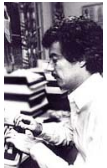
Aan de slag