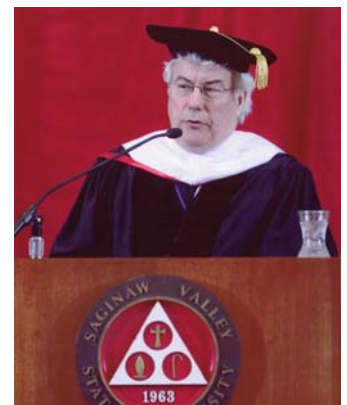
Eredoctoraat in de letterkunde aan de Saginaw State University